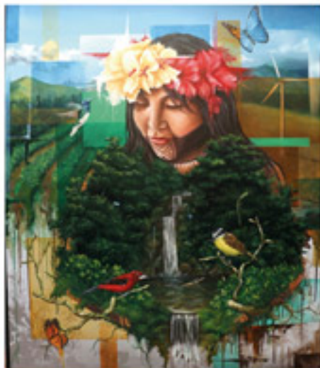
Tercer Lugar "Un abrazo de vida" Autor: Daniel Escobar De Sedas.