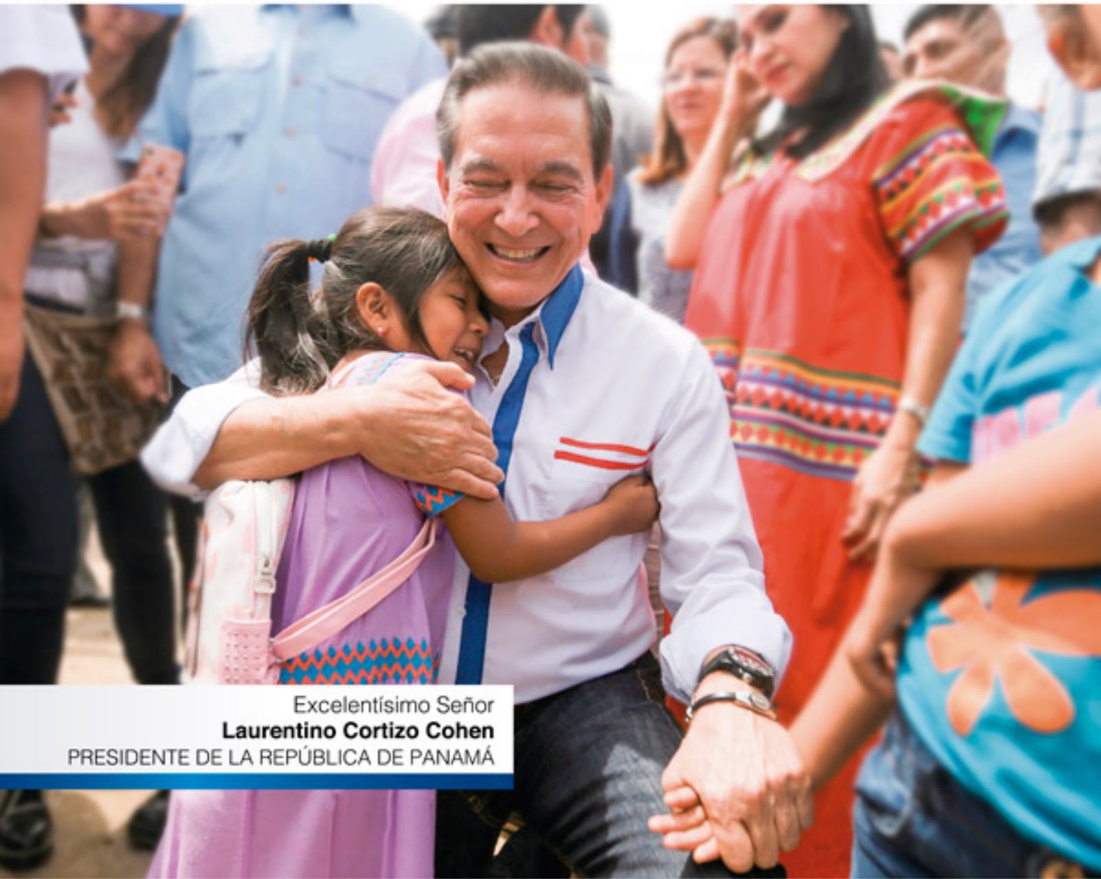
Excelentísimo Señor Laurentino Cortizo Cohen PRESIDENTE DE LA REPÚBLICA DE PANAMÁ