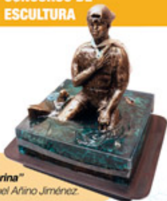
Primer Lugar "Limpieza marina" Autor: Manuquel Añino Jiménez.