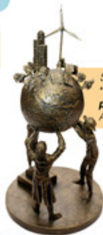
Segundo Lugar "Un mundo sostenible para las futuras generaciones" Autor: Gima O. Gutiérrez V.