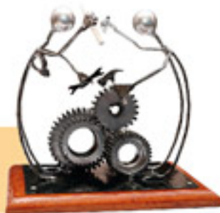
Tercer Lugar "Nuestra igualdad" Autor: Denis Vega S.