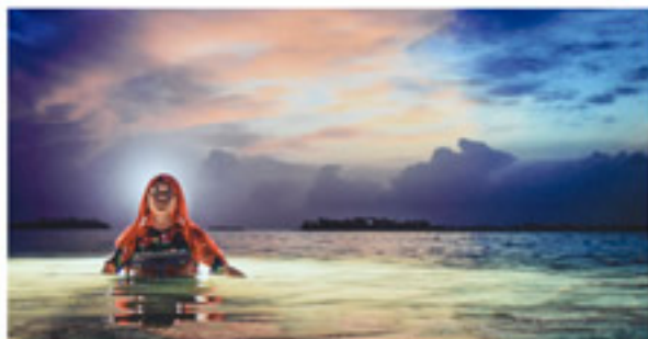
Color - Tema libre, Premio Banco Nacional "Luz del mar", Autor: Grey Díaz.