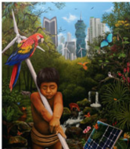
Primer Lugar "Armonía, tecnología y naturaleza" Autor: José Luis Rodríguez.