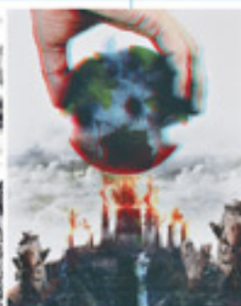
Digital Experimental "Alteración" Autor: Javier Reyes.