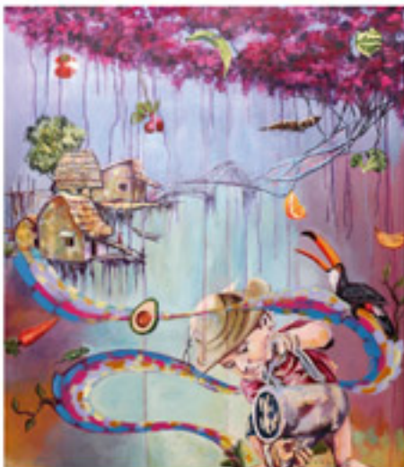
Segundo Lugar "Seamos uno por Panamá" Autor: Ariel Humberto Márquez.