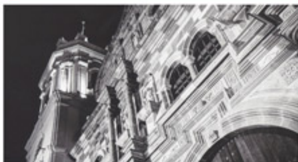
Histórica - Monocromo, Premio Internacional de Seguros, S.A. "Una joya histórica, vuelve a renacer" Autor: Joel Antonio Aguilar Hernández.