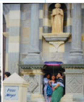
Prensa "Refugio celestial" Autor: Pastor Morales.