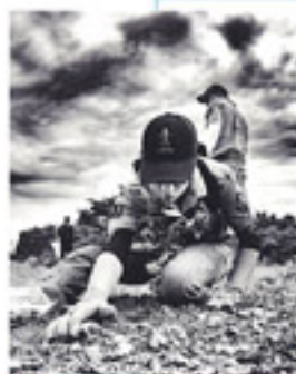
Monocromo "Juntos por la biodiversidad" Autor: Bolívar Sánchez.